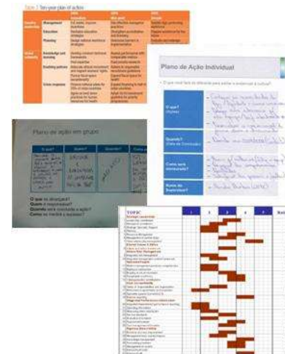
Planos de Ação